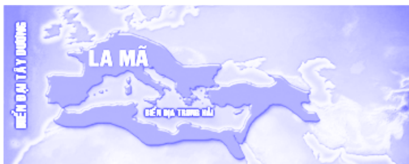
Bốn đế quốc trong Đa-ni-ên 2